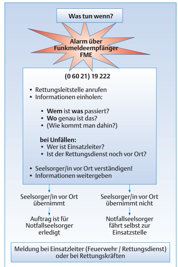
Abb. 3: Einsatzablauf Notfallseelsorge Aschaffenburg

Das Team besteht seit Juli 1998. Entstanden ist es aus einem offiziellen Anliegen der Kirchen in Bayern, die auch für entsprechendes Personal Sorge tragen. Dies bedeutet, dass die insgesamt zwanzig Seelsorger in Aschaffenburg Mitte allesamt hauptberuflich in der Kirchenarbeit tätig sind. Den Dienst in der Notfallseelsorge versehen sie allerdings ehrenamtlich.