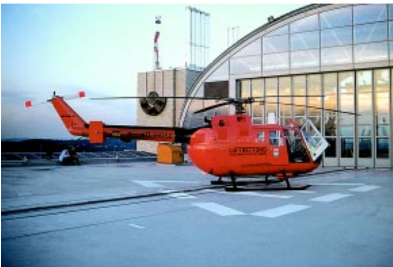
Abb. 2: Hilfe aus der Luft: Christoph 2

Alarmierung RTH Christoph 2 (Frankfurt/Main, Abb. 2 ), der um 11.47 Uhr in unmittelbarer Nähe zum Notfallort landet. Das Notfallseelsorgeteam Aschaffenburg wird zur Betreuung der Ehegattin des schwerverletzten Polizisten angefordert.