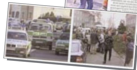
Die Geiselnahme von Aschaffenburg fand ein breites Echo in der Presse